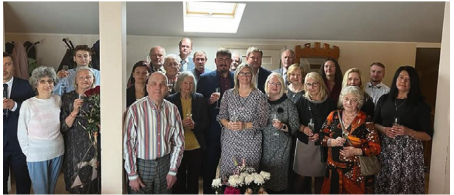
Ventspils RB 70 gadu jubilejas svinības

iespēja, ka nedzirdīgie biedri varēja līdzvērtīgi kopā ar citiem pilsētas iedzīvotājiem piedalīties Latvijas 104. dzimšanas dienas svinībās, kas notika pilsētas centrā. Runām un dziesmām bija nodrošināts surdotulkotājs.