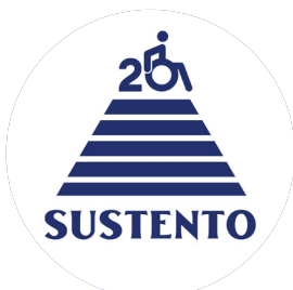
Gada draudzīgākā NVO LATVIJAS CILVĒKU AR ĪPAŠĀM VAJADZĪBĀM SADARBĪBAS ORGANIZĀCIJA "SUSTENTO"