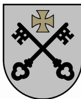
Gada atbalstošākā pašvaldība RĪGAS VALSTSPILSĒTAS PAŠVALDĪBA