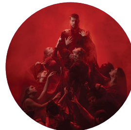
Gada pasākums/notikums TEĀTRA IZRĀDE "DRAKULA"