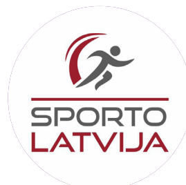
Gada sadarbības partneris BIEDRĪBA "SPORTO LATVIJA"