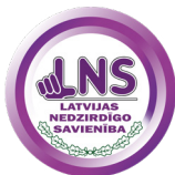
Gada reģionālā biedrība LNS SMILTENES REĢIONĀLĀ BIEDRĪBA