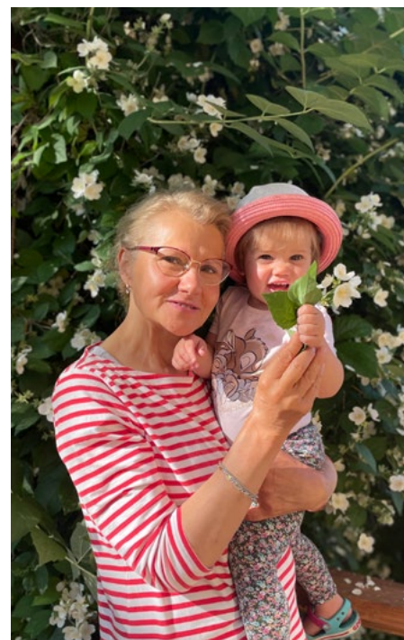
Skaidrīte ar mazmeitu

Koledžā studentiem pasniedzu zīmju valodas lekcijas. Tagad un arī agrāk studenti vienmēr bijuši tuvi un mīļi sirdij. Protams, vienmēr ir nedaudz skumji, kad viņi pabeidz koledžu, kad