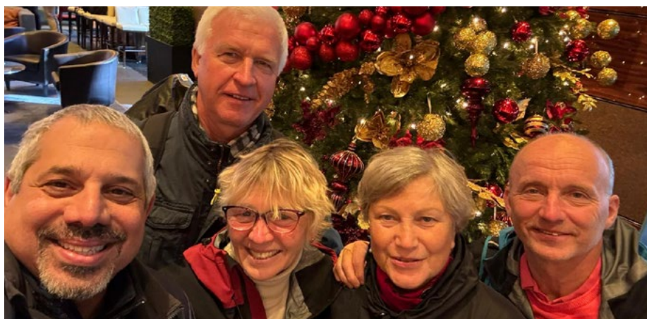
Straziņi un Kūsku pāris kopā ar gidu Ņujorkā.

Kopumā godam un skaisti tika izceļotas divarpus nedēļas. Šis bija pirmais garais ceļojums ar vairākiem pārbraucieniem dažādās valstīs. Esam bijuši tālos ceļojumos – Austrālijā, Sanfrancisko, Indijā... Mums jau ir nākamais ceļojuma galamērķis ielānots – tas lai paliek noslēpumā! Praktisks ieteikums ceļotājiem – visu darīt savlaicīgi un mērķtiecīgi. Nepieciešamas vismaz laba (pamata) līmeņa angļu valodas zināšanas, jo Wi-Fi var nestrādāt. *