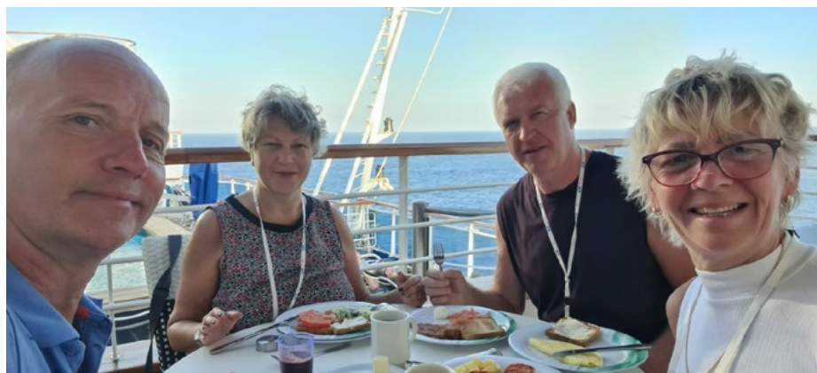
Brokastis uz kuģa.