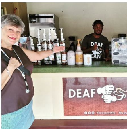
Kafejnīca "DEAF CAFE", Jamaika.

Kolumbija! Kamēr citās valstīs bija viens gids, šoreiz klāt bija divi vietējie gidī (liecina par augstu bīstamības līmeni – aut. piez.). Gidī ļoti uzmana tūristus katrā solī, katrā metrā un nenolaiž acis no neviena tūrista. Trāpījās lietains laiks. Tur ir skaista, atšķirīga kultūra. Sievietes, ģērbusās ļoti krāšņos tērpos, uz galvas nes lielus grozus ar augļiem. Taču fotografēties strikti neļāva. Suvenīru veikalos, bodēs un it visur redzami slavenie zaļie Kolumbijas smaragda akmeņi. Atpakaļceļā uz ostu sastapām daudz pāvus un redzējām kokus – pilnus ar papagaiļiem. Bijām pārsteigti – zoodārzā redzētie pāvi ir tik karaliski skaisti, bet tajās ielās – noplukuši, nekopti... Tie arī prot uzbāzties un