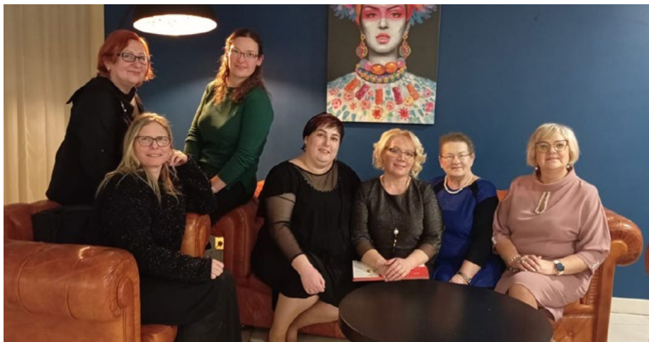
Dace ar saviem kolēģiem.

Biedrībā strādāju jau no 1967. gada vasaras, toreiz man bija 21 gads. Pavadīju iepriekšējo darbinieci pensijā un stājos viņas vietā. Dzīvojām aktīvi – dziedājām, spēlējām teātri, sportojām. Organizēju dažādas ekskursijas.