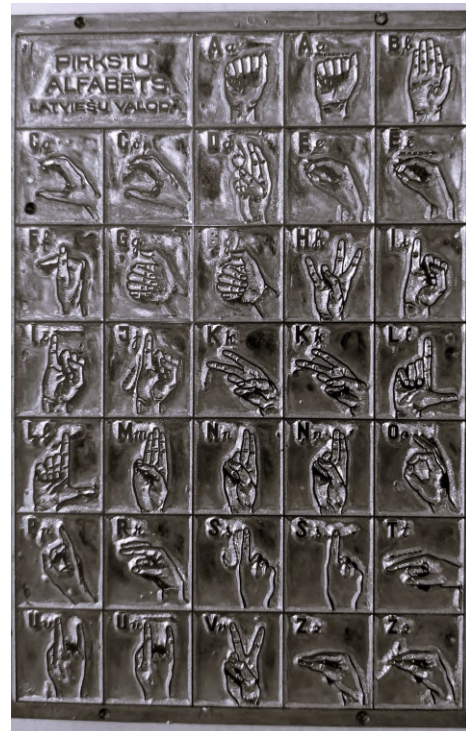
1956. gadā izgatavotā metāla matrica ar latviešu pirkstu alfabēta attēlojumu (SIA "LNS Rehabilitācijas centrs" arhīvs).

Rehabilitācijas centrā glabājas arī 1956. gadā izgatavota metāla matrica ar latviešu pirkstu alfabēta attēlojumu 9 x 15 cm lielumā. Taisnstūrveida plāksne sadalīta atsevišķos lakumos, kuros reljefā attēloti pirkstu alfabēta burti un tām atbilstošas roku formas.