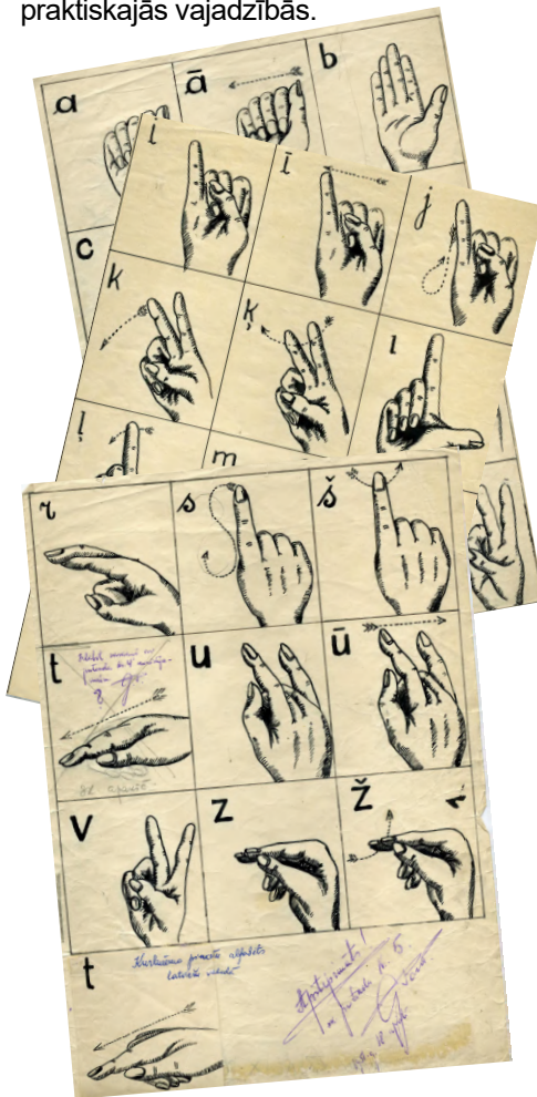
Latviešu pirkstu alfabēta zīmējuma fragments ar atsevišķu burtu roku pozīcijām un kustību norādēm.