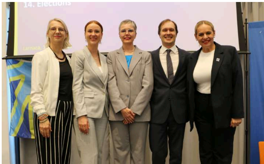
Jaunievelētā Eiropas Nedzirdīgo savienības valde.

Otrajā dienā notika EUD kārtējā Ģenerālā asambleja – tā bija sabraukuma galvenā darba diena. Delegāti izskatīja un apstiprināja darba kārtību, iepriekšējās Ģenerālās asamblejas protokolu, 2025. gada darbības pārskatu, finanšu pārskatu un EUD darba programmu 2026. gadam. Pirms EUD 2026. gada budžeta apstiprināšanas tika nolemts tomēr nepalielināt biedru naudas apmēru, jo ne visi biedri to spētu samaksāt. Tā vietā tika nolemts, ka katram biedram būs jāmaksā 670 EUR maksa par dalību Ģenerālajā asamblejā, savukārt EUD biedriem